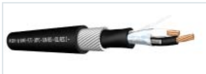
Figura 5: Armadura de alambres helicoidales

ta y luego las aislaciones de los conductores. En estos casos, la protección se brinda por medio de una armadura de acero cincado de distintos modelos. Pueden ser flejes helicoidales, alambres helicoidales o trenza de alambres. En lo que respecta a cables de instrumentación, la armadura más utilizada es la de alambres helicoidales (Ver figura 5) por ser la más robusta y brindar una cobertura superior al 90%, además es el tipo de armadura especificada por excelencia en la industria petroquímica.