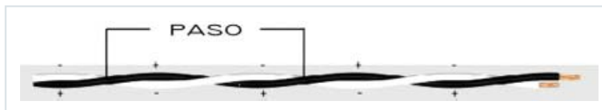
Figura 1: Dos conductores aislados, retorcidos, con un paso fijo y estable.

• Torzado (Pareado): Cuando se refiere a transmisión de señales, lo primero que se solicita es el uso de cables con conductores formando pares (2 conductores), ternas (3 conductores) o cuadretes (4 conductores). Un par consiste en dos conductores aislados, retorcidos, con un paso fijo y estable, los cuales forman un bucle o línea de un circuito (Ver figura 1).