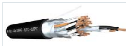
Figura 4: Blindaje individual más uno general

• Si un cable multipar lleva señales analógicas debe usarse un blindaje individual más uno general (BI + BG) porque existe la probabilidad que la señal de un par interfiera en la del par adyacente (Ver figura 4)