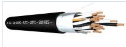
Figura 3: Blindaje general

• Si un cable multipar lleva señales digitales alcanza con un blindaje general (BG) ya que no se producen interferencias entre este tipo de señales (Ver figura 3)