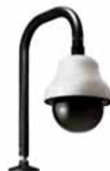
Ejemplo de montaje en parapeto.

Los montajes en parapeto se utilizan para carcasas montadas en azoteas o para elevar la cámara con el fin de conseguir un mejor ángulo de visión.