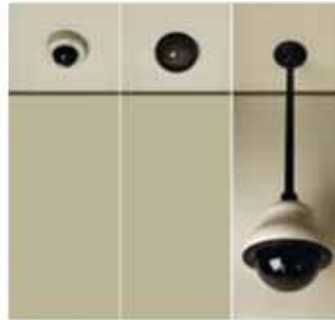
Ejemplos de montajes: en superficie (izq.), empotrado (centro) y colgante (der.)