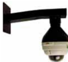
Ejemplo de montaje en pared con un kit colgante para una cámara domo fija.

Otros montajes especiales son el montaje de kit colgante, que permite montar una cámara de red fija de un modo similar a una carcasa para domos PTZ.