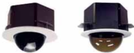
Ejemplos de carcasas para cámaras de red fijas montadas a ras del techo.

También es importante el modo en el que están montadas las cámaras y las carcasas. Una cámara de red fija convencional y un domo PTZ montadas en la superficie del techo son más vulnerables a ataques que un domo o domo PTZ montados a ras del techo o pared, donde sólo se ve la parte transparente de la cámara.