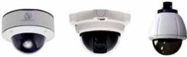
Ejemplos de carcasas resistentes al vandalismo para una cámara de red fija pequeña o compacta (izquierda), para un domo fijo (centro) y para un domo PTZ (derecha).