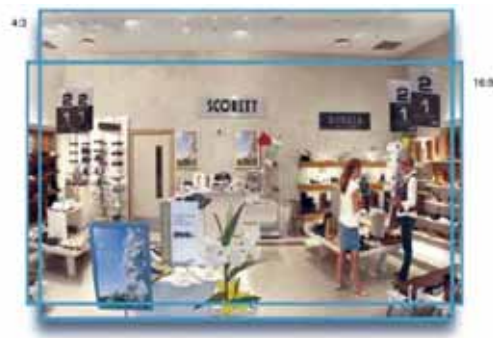
Ilustración de las relaciones de aspecto 4:3 y 16:9

La resolución megapíxel también consigue un mayor grado de flexibilidad, es decir, es capaz de proporcionar imágenes con distintas relaciones de aspecto (la relación de aspecto es la relación entre la anchura y la altura de una imagen). Una pantalla de televisión convencional muestra una imagen con una relación de aspecto de 4:3. Las cámaras de red con resolución megapíxel pueden ofrecer la misma relación, además de otras, como 16:9. La ventaja de la relación de aspecto 16:9 es que los detalles insignificantes, que suelen encontrarse en las partes superior e inferior de una imagen con un tamaño convencional, no aparecen y, por lo tanto, puede reducirse el ancho de banda y los requisitos de almacenamiento.