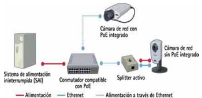
Un sistema que utiliza la Alimentación a través de Ethernet

Además, la tecnología PoE (Alimentación a través de Ethernet), que no se puede aplicar a un sistema de video analógico, se puede utilizar en un sistema de video en red. PoE permite a los dispositivos en red recibir alimentación de un conmutador o midspan compatible con PoE a través del mismo cable Ethernet que transporta los datos (video). Ofrece un ahorro sustancial en los costes de instalación y puede aumentar la fiabilidad del sistema.