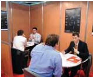
La ronda de negocios, un espacio destinado para que las empresas lleguen a acuerdos comerciales.

La próxima edición de Seguriexpo Buenos Aires se realizará del 5 al 7 de Junio de 2013 mientras que la industria de Safety, Fire & Security tendrá su encuentro bienal en Intersec Buenos Aires del 15 al 17 de Agosto de 2012. Ambas muestras se realizarán en La Rural Predio Ferial de Buenos Aires ■