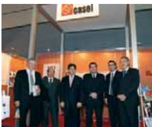
Autoridades de las Cámaras del sector, el Gobierno porteño y de la organización del evento.