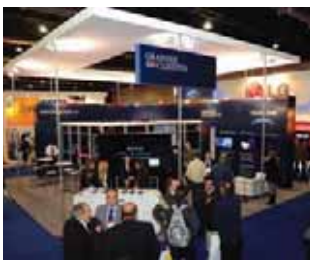
Los visitantes recorrieron la muestra viendo cada una de las novedades.