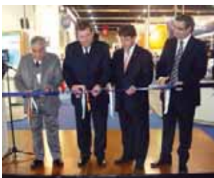
El tradicional corte cinta inauguró formalmente Seguriexpo.

SoftGuard estuvo presente en Seguriexpo como con un amplio stand, brindando demostraciones del sistema integral para monitoreo de alarmas. Se realizó el lanzamiento del nuevo Catálogo de Integraciones de SoftGuard, presentando nuevas tecnologías y equipamientos compatibles para ampliar los horizontes de negocios de las empresas usuarias de SoftGuard, entre ellos Bomba de humo antirrobo, Tracking GPS para mascotas, Equipos GPS para seguimiento vehicular, Posicionamiento Bluetooth para personas y bienes, y Vi-