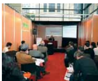
El marco académico, como siempre, fue uno de los ejes de la exposición