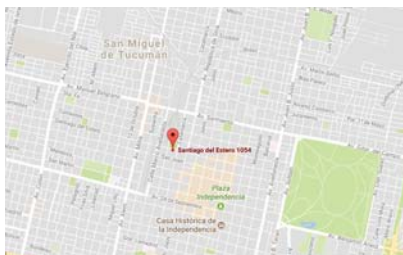
Sucursal Tucumán: Santiago del Estero 1054 PB, Oficina 504, San Miguel de Tucumán

citación, en el que trabajaremos con las marcas enfocándonos en la presentación de nuevos productos y tecnologías a nuestros clientes”, amplió el directivo.